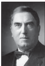
Maurice Duruflé (1902-1986)